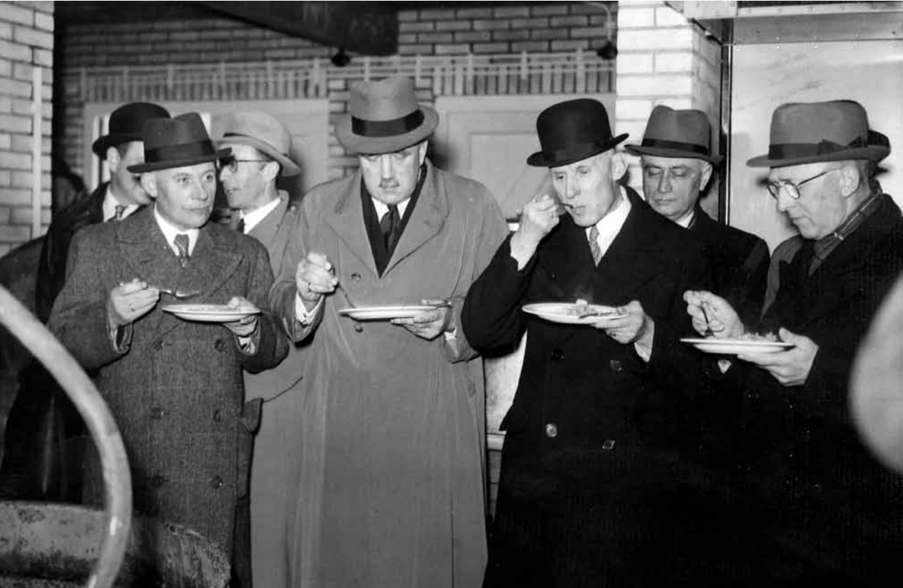
▲ Opening van de centrale gaarkeuken in Den Haag, 2 april 1941. Tweede van links is ir. S.L. Louwes, directeur-generaal van de Voedselvoorziening.