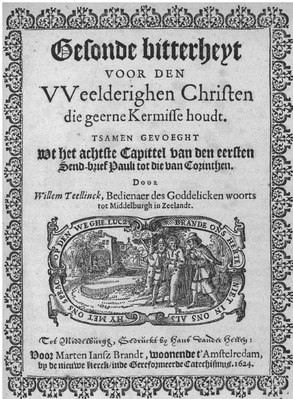
▲ Voorblad pamflet van Willem Teellinck. W. Teellinck, Gesonde bitterheyt voor den weelderighen Christen die geerne Kermisse houdt (Middelburg 1624). Koninklijke Bibliotheek, Den Haag.