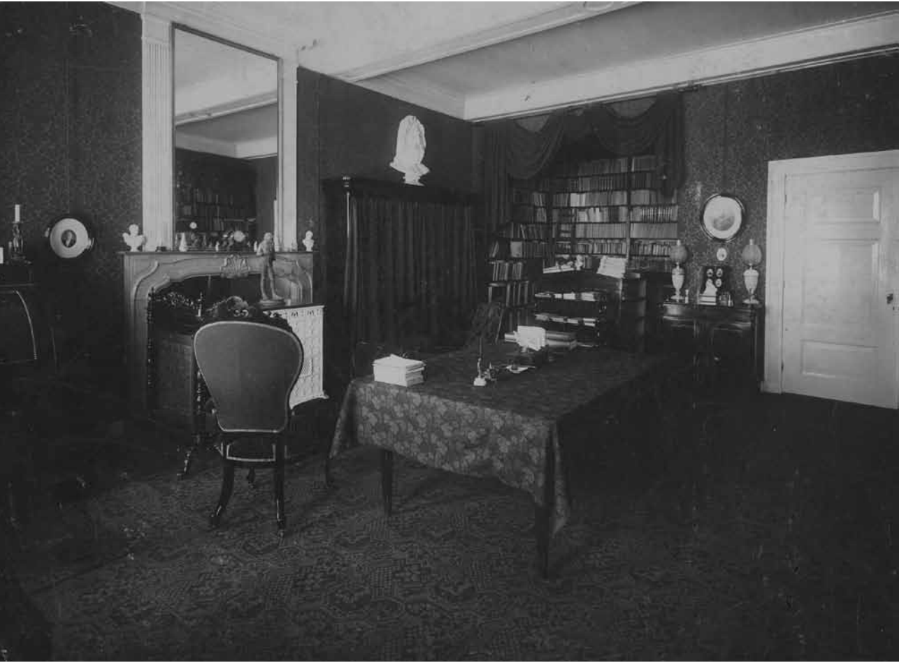
▲ De studeerkamer van Robert Fruin, Steenschuur 9, Leiden, eind negentiende eeuw.