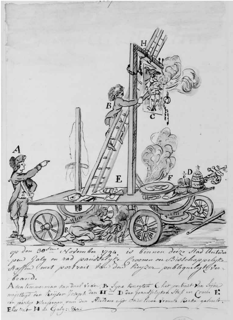
▲ Verbranding van een wagen beladen met symbolen van het ancien régime bij de opening van de Antwerpse Tempel van de Rede in 1794. Aan de galg hangt een portret van keizer Jozef II. P.A.J. Goetsbloets, 1794, Koninklijke Bibliotheek van België.