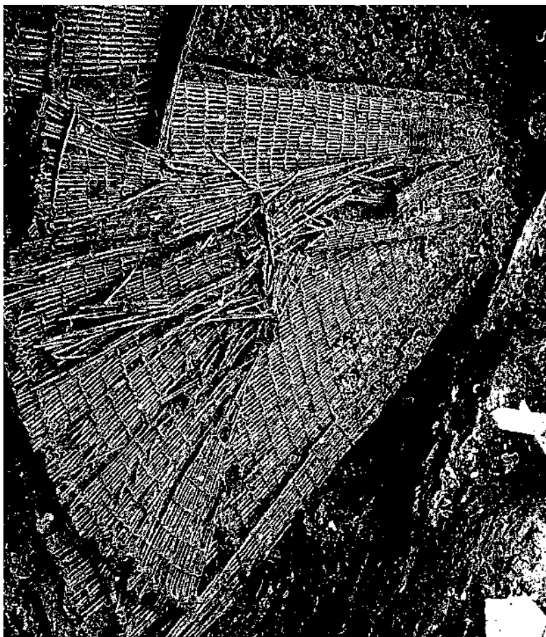
Bergschenhoek, visfiuk, die de uitzonderlijke conserveringsmogelijkheden van de delta demonstreert. Ouderdom 4300 v.Chr., vondstdiepte: acht meter beneden zeeniveau.