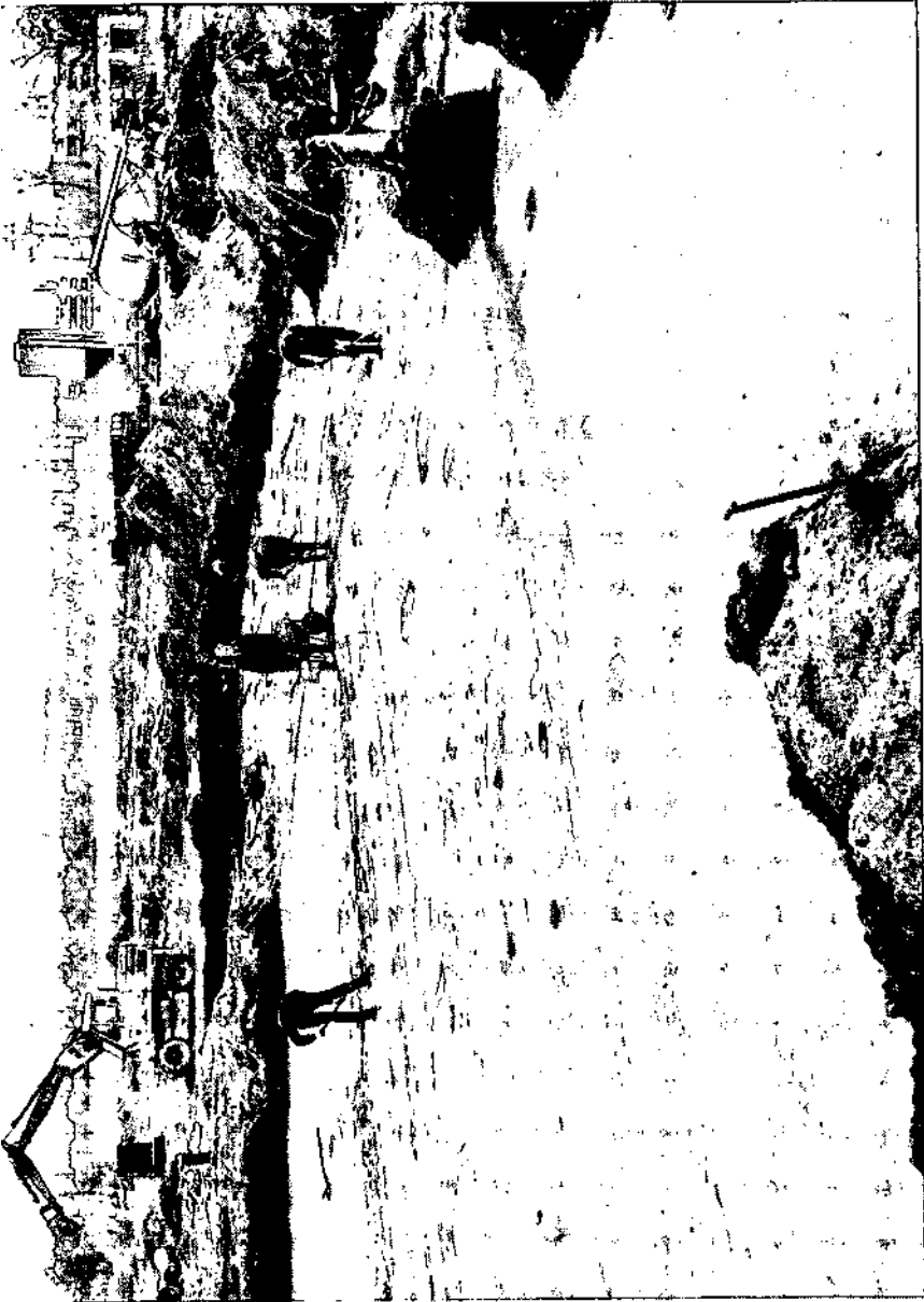
Oss-Ussen, verschillende elkaar oversnijdende (dat wil zeggen opeenvolgende) plattegronden van huizen, behorende bij een 7 hectare grote, omheinde, inheemse nederzetting uit de Romeinse tijd. Het is een klein onderdeel van een van de vele grootschalige nederzettingsonderzoeken, uitgevoerd door verschillende instituten in alle delen van ons land.