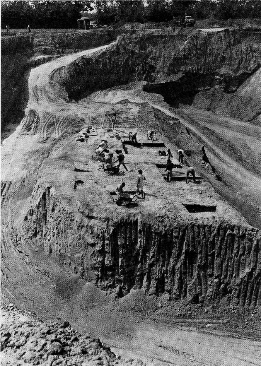
Maastricht, Belvédère, overzicht van de opgraving van site K, 1986. De winning van löss en zand is al zover voortgeschreden dat de site op een 'eiland' in de groeve is komen te staan. Het gaat om een kampplaats met een ouderdom van circa 250.000 jaar.