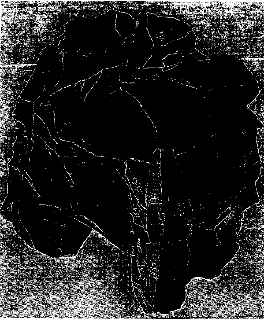
Maastricht, Belvédère, weer in elkaar gezette knol vuursteen, afkomstig van cite C.