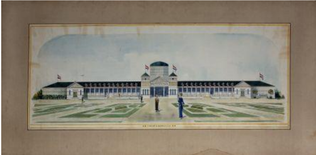
Aquareltekening van het gehele paviljoenterrein.

Pamfletten, congressen, debatten en demonstraties zijn bekende feministische actiemiddelen. Dat Nederlandse feministen tegen het einde van de 19e eeuw ook tentoonstellingen organiseerden is minder bekend. De eerste grote expositie van de vrouwenbeweging, de Nationale Tentoonstelling van Vrouwenarbeid, werd gehouden in de Houtrusthallen in Den Haag in 1898 en trok ruim 90.000 bezoekers.