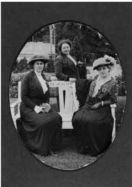
Mia Boissevain, Rosa Manus (mede-initiatiefneemster) en Carrie Chapman Catt.

In de congreszaal werden elke week voordrachten gehouden over een actueel onderwerp in de vrouwenbeweging. In totaal werden er 51 voordrachten gehouden in de vijf maanden dat 'De Vrouw 1813 - 1913' duurde. Enkele bekende internationale feministen die de tentoonstelling bezochten, lieten het publiek weten dat de vrouwenbeweging zich ver buiten de Nederlandse grenzen uitstreckte. De Amerikaanse Carrie Chapman Catt, de presidente van de Internationale Bond voor Vrouwenkiesrecht, hield een vurig pleidooi voor het vrouwenkiesrecht in de Congreszaal.