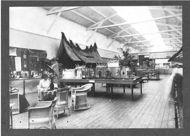
De Indische afdeling.