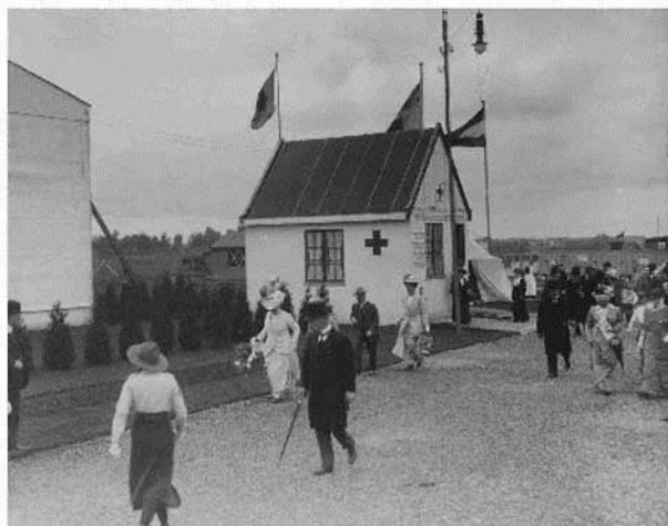
Tentoonstelling. In het midden een ehbo-post.