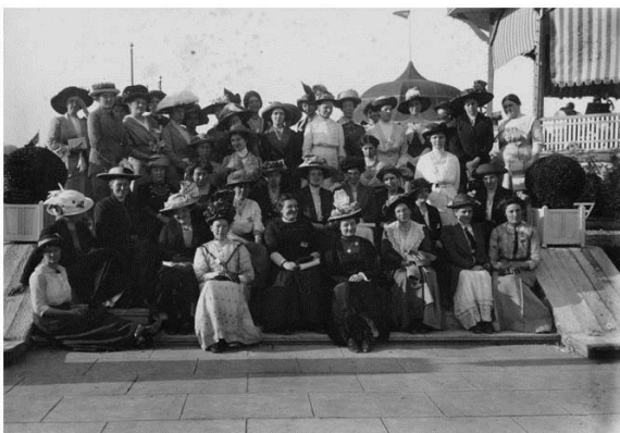
Vrouwen met een academische opleiding bezochten in verenigingsverband de tentoonstelling.

De subcommissie voor Letterkunde en Toneel wilde in haar afdeling een overzicht geven van het werk van moderne Nederlandse schrijfsters en toneelspeelsters. Boeken en portretten van schrijfsters en actrices sierden de wanden en er werd een reeks voordrachten en toneelvoorstellingen georganiseerd. De bekende Nederlandse schrijfster Carry van Bruggen (1881-1932) was de presidente van de commissie.