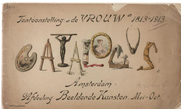
Catalogus van de commissie Beeldende Kunsten.

Naast aandacht voor vrouwen in de kunstgeschiedenis rond 1813 was er op de afdeling Beeldende Kunsten ook ruimte voor de kunst van vrouwen uit de eigen tijd. Op artistieke wijze liet de commissie Beeldende Kunsten op de voorkant van de catalogus de verschillende kunstvormen zien die Nederlandse vrouwen beoefenden.