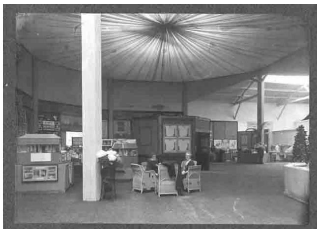
Gedeelte van de tentoonstellingsopstelling.

Hoewel de bezoekers kwamen voor de afdelingen over het vrouwenkiesrecht, onderwijs, statistiek, koloniën, maatschappelijk werk, hygiëne en ziekenverpleging, huisindustrie en de groots opgezette historische afdeling, gingen deze serieuze thema's van de vrouwenbeweging hand in hand met vermaak. Net zoals hedendaagse musea niet zonder café of restaurant kunnen, bood De Vrouw 1813 - 1913 ook eet- en drinkgelegenheden.